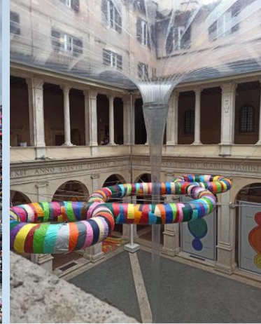
Chiostro del Bramante