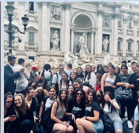
Fontana di Trevi